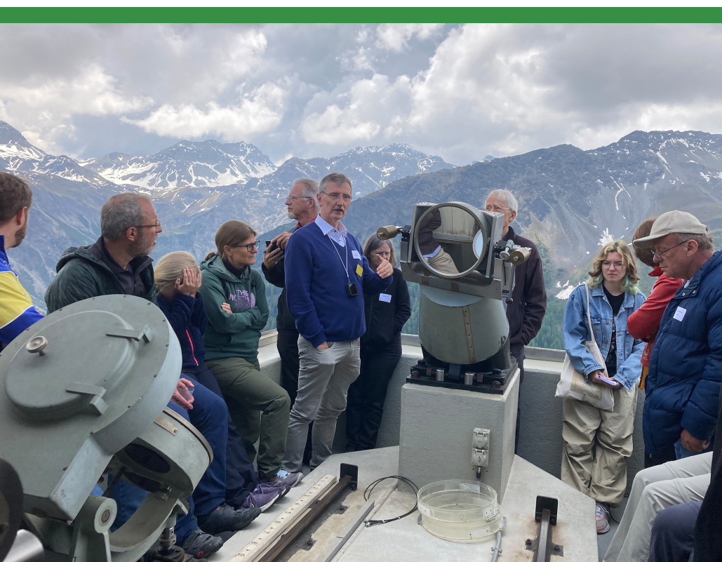
Abbildung 3: Blick auf den Coelostat, der das Sonnenlicht einfängt. Leider verunmöglichten die zu zahlreichen Wolken am Eröffnungstag eine Demonstration der Anlage.