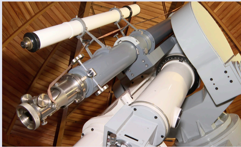
Abbildung 4: Innenansicht des alten Turms mit dem Kern-Koronagraphen (grau) auf dem Zeiss-Koronagraphen (weiss) huckepack montiert

1965 erfolgt die Installation des neuen Zeiss-Koronagraphen mit Spektroskop; der alte Kern-Koronagraph wird huckepack montiert. Zwei Jahre später ist die Fertigstellung des neuen Turms an der Reihe und wird mit einem Coudé-Refraktor von Zeiss bestückt. Der Kern wird 1980 demontiert und nach Zürich transportiert, wo er verschrottet werden soll. ◀