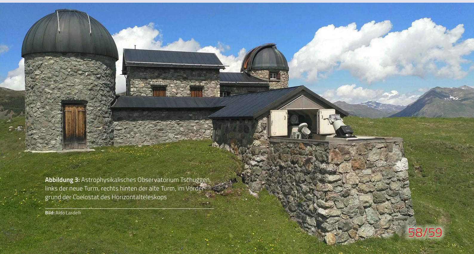
Abbildung 3: Astrophysikalisches Observatorium Tschuggen, links der neue Turm, rechts hinten der alte Turm, im Vordergrund der Coelostat des Horizontalteleskops